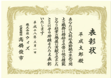
賞状全書（A3 クリーム用紙）